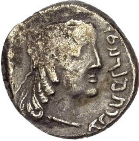
الملك النبطي عبادة الثالث

إجحافاً واضحاً في هذا القول؛ فالأحداث السياسية التي حدثت في عهده (للمزيد انظر: الذيب، ٢٠١١م: ٤٠-٤٥)، وموافقته على مساندة هذه الحملة ودعمها لوجستياً وعسكرياً، المتمثل في: تذليل الصعاب والمواقف كافة على الأرض عن طريق السماح للجيش الروماني بالمرور في الأراضي التابعة للمملكة النبطية، وحسن